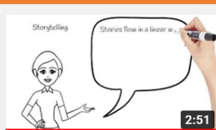
ALGOLITTLE - MODULE 3 - LESSON 2