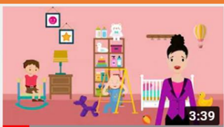
ALGOLITTLE - MODULE 3 - LESSON 1