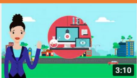
ALGOLITTLE - MODULE 2 - LESSON 1